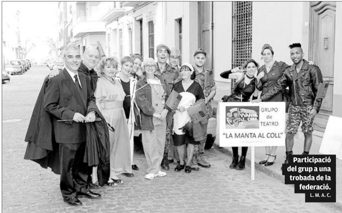
Participació del grup a una trobada de la federació. L. M. A. C.

► LA FORMACIÓ AMATEUR RECORDA ELS SEUS INICIS | CELEBRA EN PICASSENT 25 ANYS SOBRE L'ESCENARI ► EL PRESIDENT RECONeix LES DIFICULTATS DELS ÚLTIMS TEMPS EN EL MÓN DE LA CULTURA